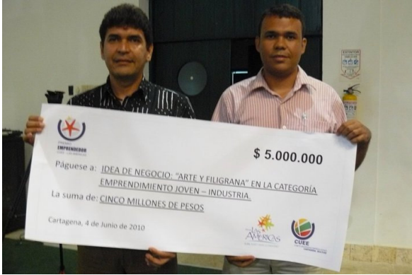
El Director del Emprendimiento de la CUC y el ganador del premio.